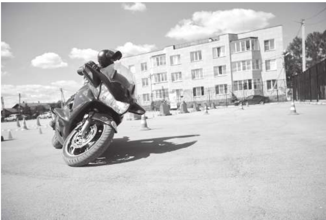
Фигурное управление мотоциклом продемонстрировали в этом году 73 любителя и профессионала этого спорта

Старты в Боровском районе - первые в России после снятия ограничений, связанных с коронавирусом. Соску-