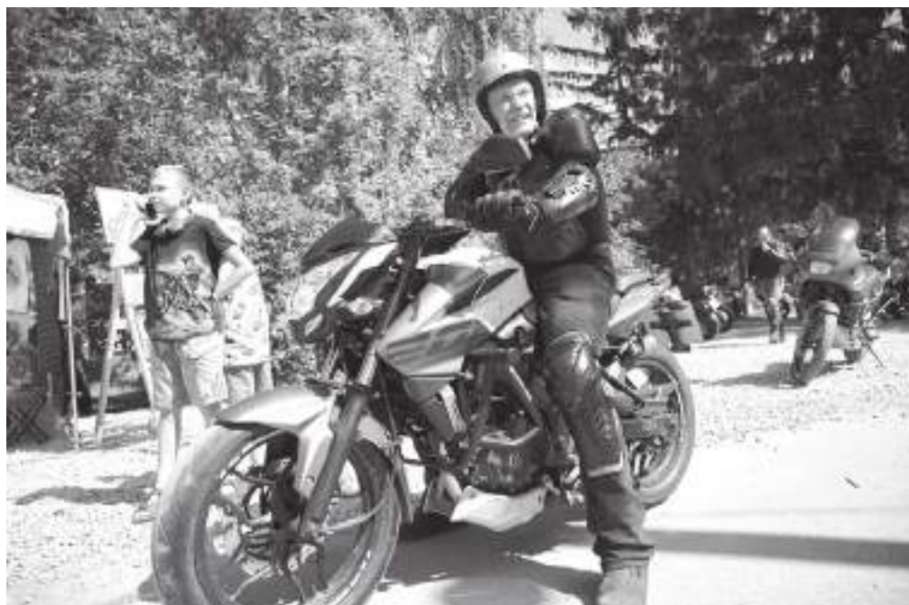
Возраст в мотосостязаниях не имеет значения