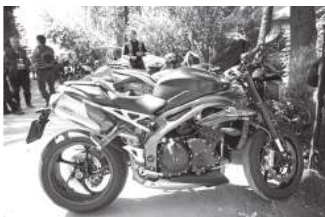
В соревнованиях могут участвовать «железные кони» любых моделей

чившиеся участники рвутся в бой. Но для начала они несколько раз проходят трассу пешком. Это нужно для визуального и физического запоминания пути - определиться, где и с какой скоростью ехать, под каким углом наклонять мотоцикл. Постараться отметить так называемые «затычные» места, то есть, те участки, где разворот особенно проблематичен.