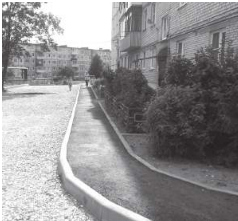
Особое внимание уделяют качеству укладки асфальта