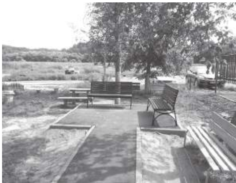
У жителей улицы Фабричной появилась уютная площадка для отдыха