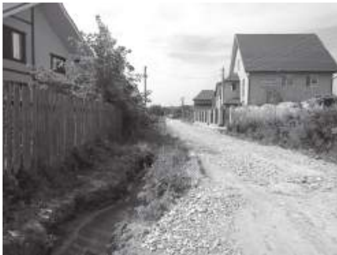
Теперь на улице Ольховой можно дышать свежим воздухом