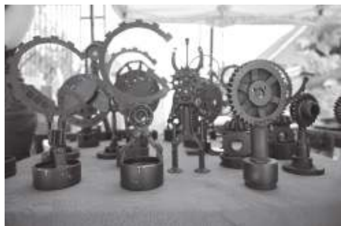
Награды были очень оригинальными

Второй раз подряд в селе Совхоз «Боровский» состоялись Всероссийские соревнования по мотоджимхане