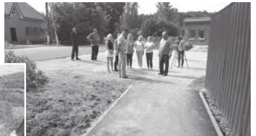
Комиссия прошла по отремонтированному участку, оценивая качество работ

Работы по ремонту тротуара выполняла подрядная организация из города Королёва. В райцентре это первый её контракт, и можно заключить, что с задачей компания справилась. По мнению принимающей объект комиссии, дорога стала даже удобнее: её ширина изменилась с 1,5 до 1,7 метров, что увеличивает пропуск-