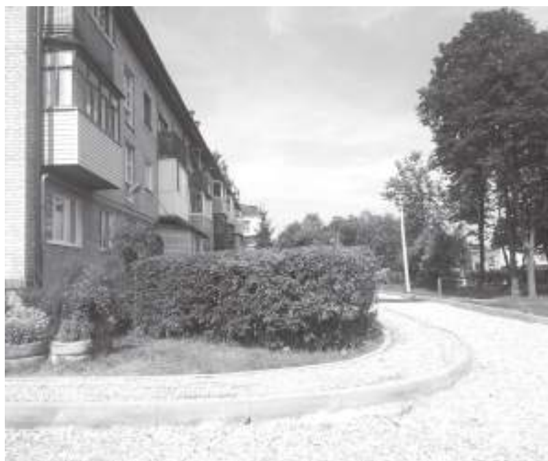
Полным ходом идет благоустройство на улице Гагарина