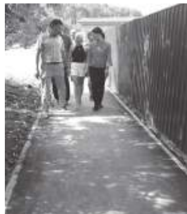
Комиссия осматривает соединение тротуара с автомобильной дорогой

ми ногами. В целом результат получил высокую оценку, хотя недочёты всё-таки выявлены. К ним комиссия отнесла, к примеру, непродуманные съезды: подрядчик отсыпал их основание щебнем, в то время как при движении пешеходов, колясок и велосипедов он будет разлетаться в стороны. Вызвали критические замечания и места стыка тротуара с проезжей частью, и устройство канав для воды. «Определённые претензии мы под-