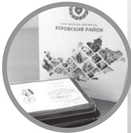
Врачи Боровского района удостоены региональной награды «За медицинскую доблесть»

Мужество и самоотверженный труд врачей подучили высо-