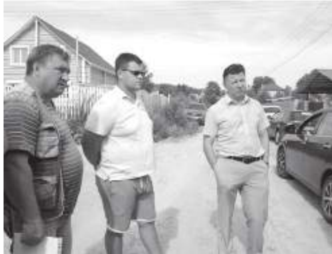
Представители администрации, жители и подрядчики обсудили реализованный проект

Опыт показал, что заинтересованность жителей в самом деле повышается. Они активно принимают участие в создании проекта, следят за выполнением работ, и есть надежда, что в будущем будут ответственно относиться